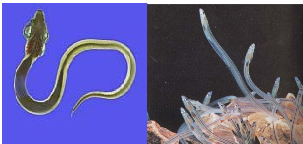
Figura 3. Quando chegam à foz dos rios americanos e europeus, as larvas da enguia já sofreram a metamorfose e estão transformadas em enguias-de-vidro, angulas ou meixão.

A enguia europeia, pelo seu lado, permanece na fase larvar durante dois anos e meio a três anos mais uma vez exactamente o tempo necessário para as correntes a transportarem até à embocadura de rios europeus.