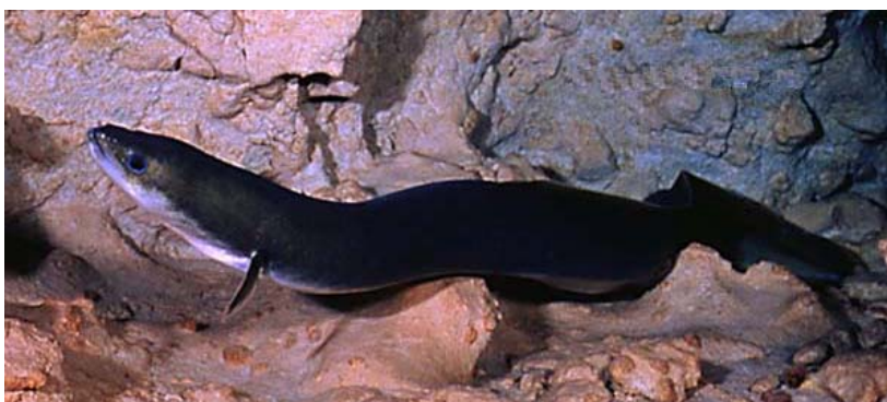
Figura 4. Enguia prateada ( A. rostrata ) antes da migração para o mar.

Algumas dessas alterações são externas. A pele verde-bronze ou amarela adquire um tom prateado e brilhante (é a chamada enguia-prateada) (Figura 4). Esta cor, torna a localização da enguia mais difícil no oceano. Os olhos aumentam até ocuparem quase por completo as superfícies laterais da cabeça o que, eventualmente, lhes amplia a capacidade de visão nas profundezas marinhas fracamente iluminadas.